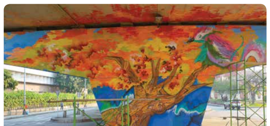
La Alcaldía compartió con la comunidad en diversas etapas previas a la Jornada de Vida y Equidad.