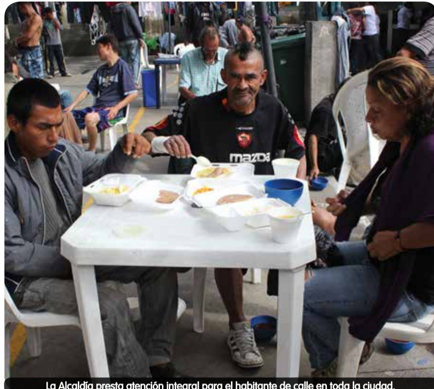
La Alcaldía presta atención integral para el habitante de calle en toda la ciudad.

Entre otras estrategias, se adelantan acciones de resocialización, se contribuye al mejoramiento de las habilidades para la empleabilidad y se brinda acompañamiento psicológico continuo, terapia ocupacional y alimentación, en convenio con Metrosalud.