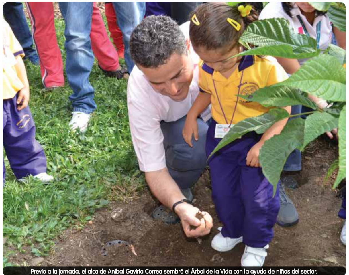
Previo a la jornada, el alcalde Aníbal Gaviria Correa sembró el Árbol de la Vida con la ayuda de niños del sector.

$13.500 millones priorizados en los cinco proyectos.