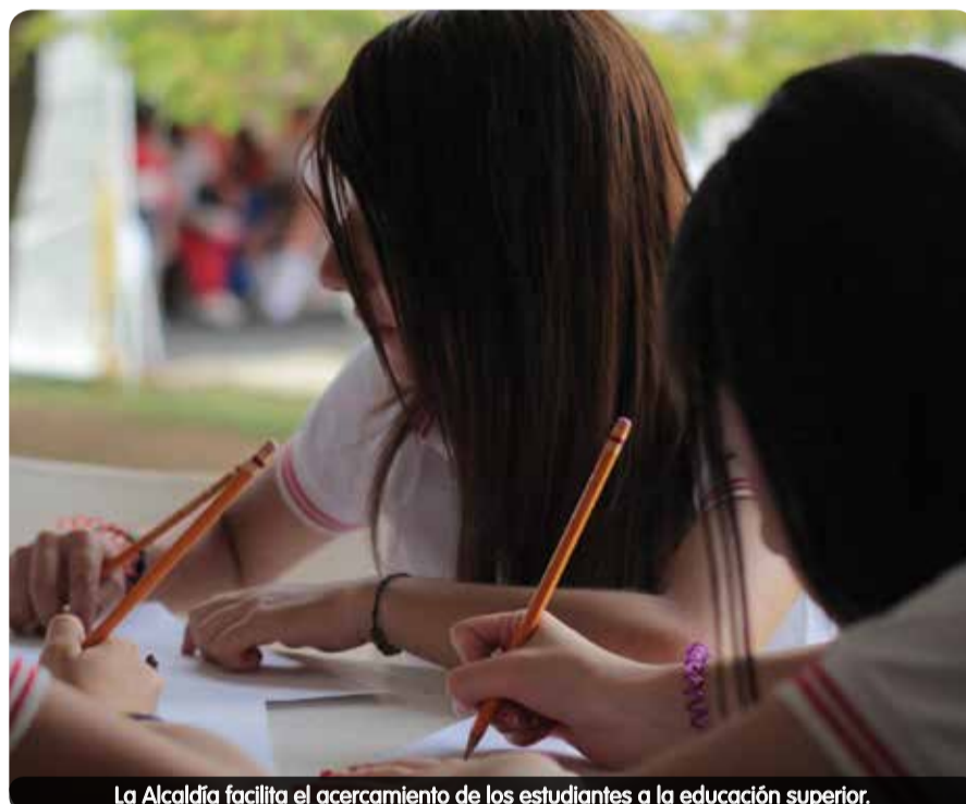
La Alcaldía facilita el acercamiento de los estudiantes a la educación superior.

Los trámites e información referente a la Agencia Sapiencia estarán disponibles en los Mascerca, Casas de Gobierno y Centros de Servicio a la Ciudadanía de las 16 comunas y 5 corregimientos de la ciudad, como una apuesta de la Alcaldía de Medellín por facilitar el acceso de la comunidad a estos servicios, por