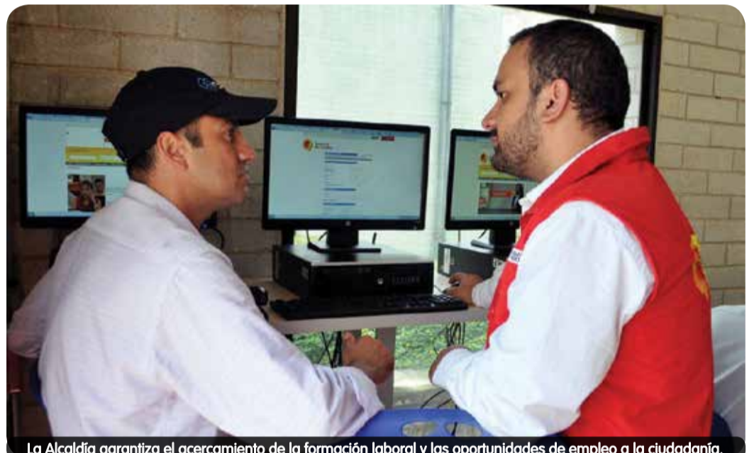
La Alcaldía garantiza el acercamiento de la formación laboral y las oportunidades de empleo a la ciudadanía.

En el primer trimestre del presente año, 4 habitantes de la Comuna 11 harán parte de las 5.317 personas que empezarán a capacitarse en programas de formación técnica laboral, con inversiones concertadas en el programa Jornadas de Vida y Equidad, además de recursos ordinarios de la unidad y del Programa de Planeación Local y Presupuesto Participativo, priorizados por la ciudadanía.