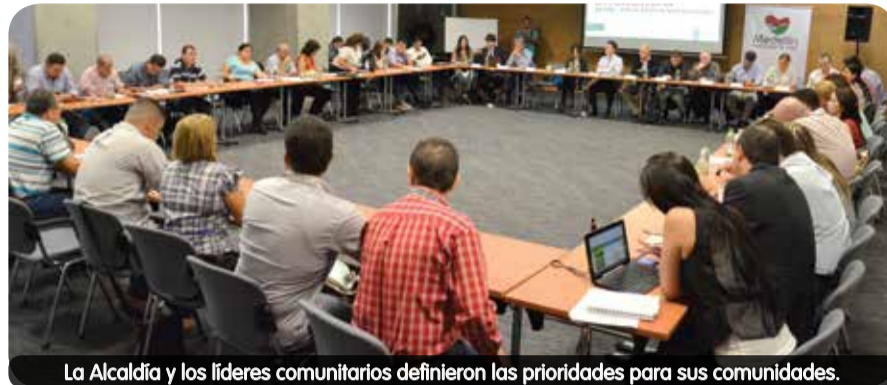
La Alcaldía y los líderes comunitarios definieron las prioridades para sus comunidades.

La Administración demostró de esta manera su apoyo y acompañamiento a las JAL, promoviendo la concertación y formulación del plan de trabajo de