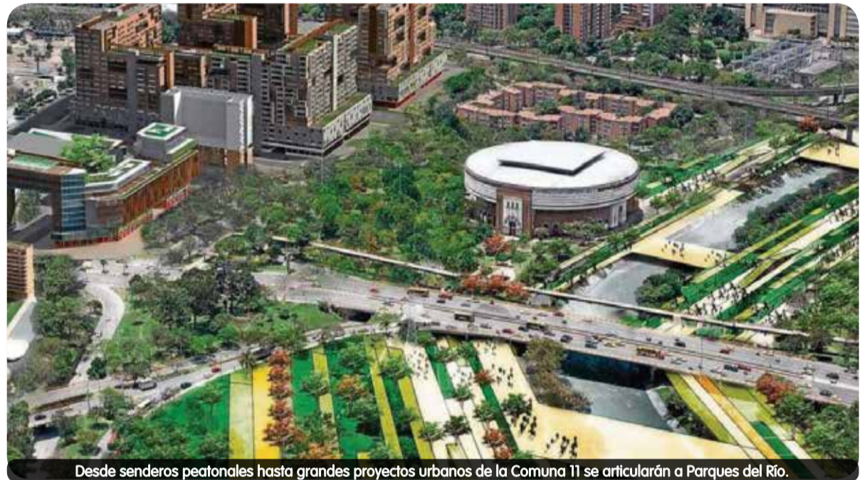
Desde senderos peatonales hasta grandes proyectos urbanos de la Comuna 11 se articularán a Parques del Río.

Con corte a marzo, la Alcaldía ha invertido $10.026 millones de un total de $10.194 que se tienen presupuestados para la adquisición de predios, en su mayoría talleres que se reubicaron en cercanías de la Terminal del Norte.