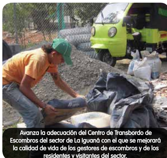
Avanza la adecuación del Centro de Transbordo de Escombros del sector de La Iguaná con el que se mejorará la calidad de vida de los gestores de escombros y de los residentes y visitantes del sector.

Con el propósito de mejorar las condiciones de trabajo de los gestores de escombros, conocidos anteriormente como “motocargueros”, la Alcaldía de Medellín adelantó obras de infraestructura para habilitar un nuevo Centro de Transbordo de Residuos de Construcción y Demolición.