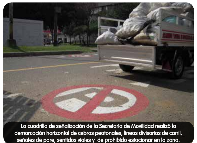
La cuadrilla de señalización de la Secretaría de Movilidad realizó la demarcación horizontal de cebras peatonales, líneas divisorias de carril, señales de pare, sentidos viales y de prohibido estacionar en la zona.